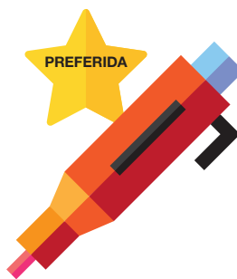
PLUMA DE INSULINA

Para la administración de insulina se prefieren las plumas de insulina a las jeringas.